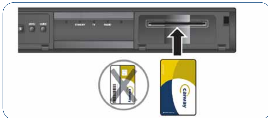
Gebruik van de smartcard bij een digitale ontvanger

Om de zenders die onderdeel uitmaken van de aanvullende tv-pakketten te kunnen bekijken, maakt u gebruik van een smartcard. U stopt de smartcard in de opening van de ontvanger met de pijl naar boven en naar voren in de ontvanger. U krijgt een E16-melding in beeld als u een zender kiest die niet onder uw huidige digitale tv-abonnement zit.