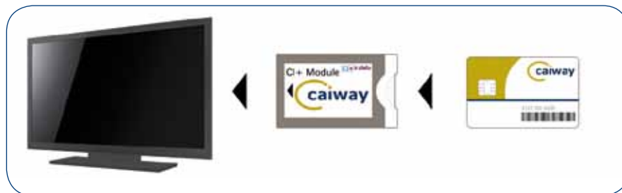
Gebruik van de smartcard bij een TV met ingebouwde digitale ontvanger